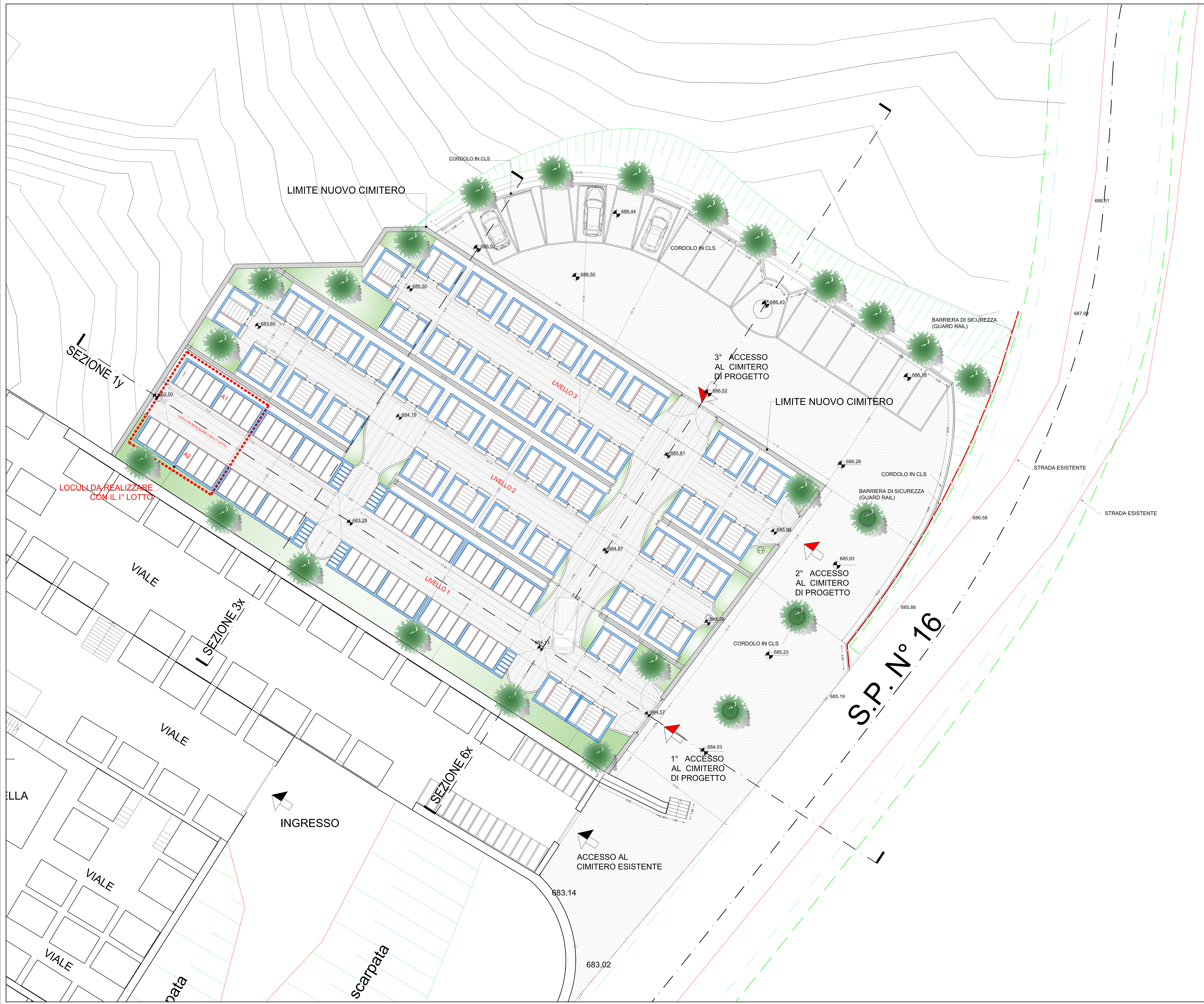
SCHEMA GRAFICO DETERMINAZIONE SUPERFICI